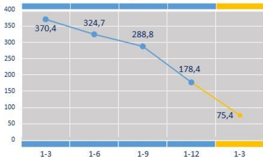
Зміна обсягів прийнятого в експлуатацію житла (до відповідного періоду попереднього року)