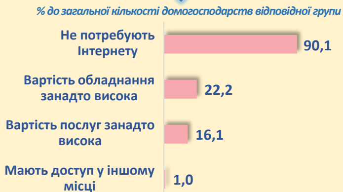
Розподіл за причинами відсутності Інтернету

Частка домогосподарств, які не мають доступ до послуг Інтернету удома складає 16,8%