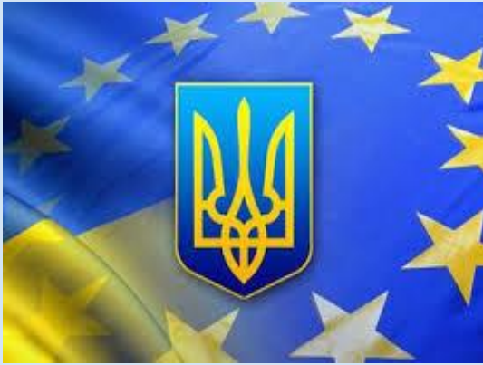
Динаміка експорту-імпорту послуг з країнами ЄС